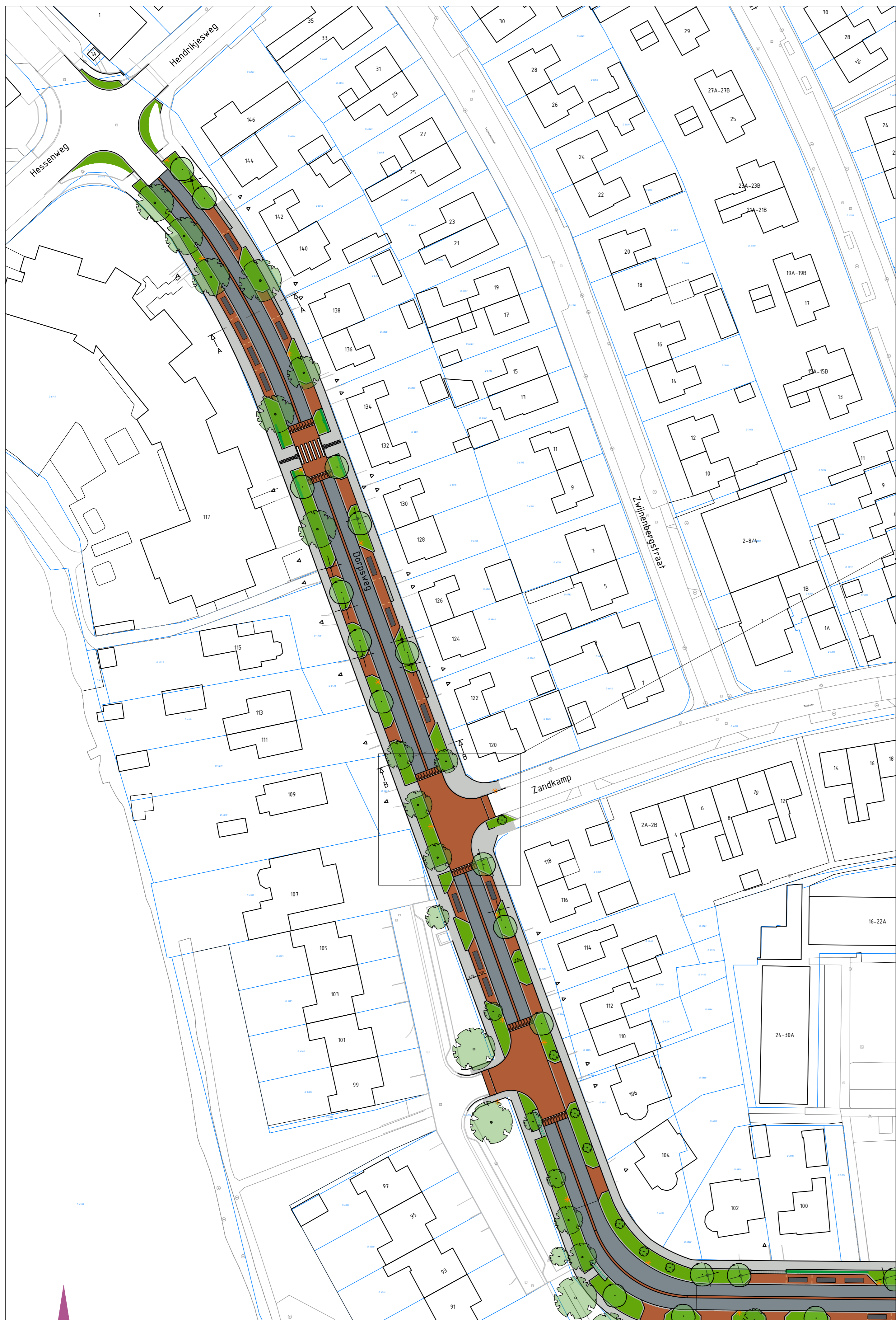
Situatie tekening schaal 1:500