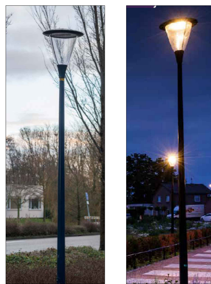
Lichtmasten - Prunus A3