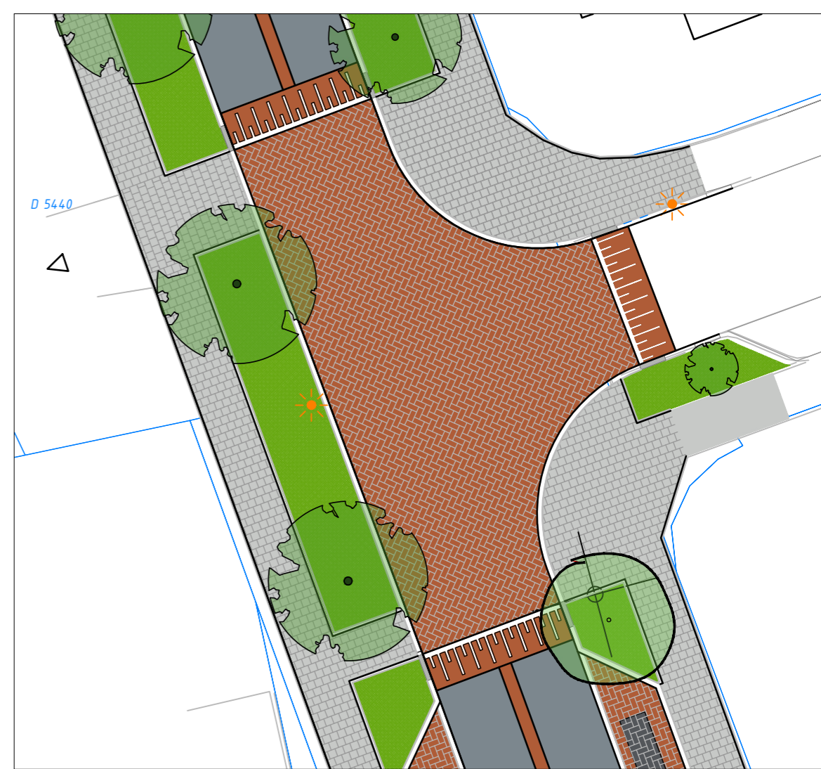
Kruispunt Dorpsweg - Zandkamp schaal 1:200