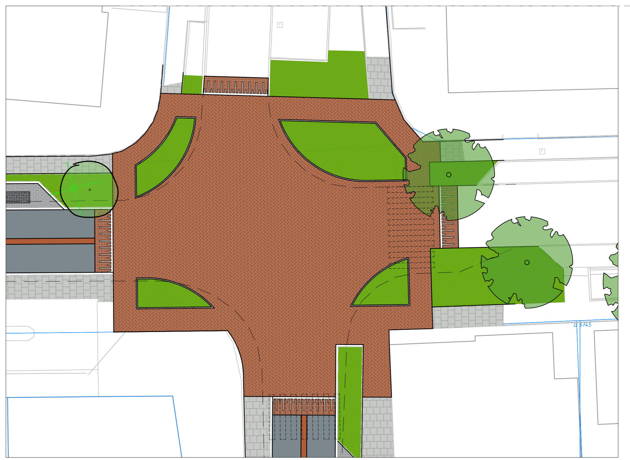
Kruispunt Hollewand - Dorpsweg - Eijerdijk schaal 1:200